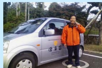
施設内を動き回るスタッフや、送迎中の連絡用ツールとして活躍